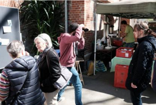
Geburtstagsfeier 10/20/130 am 30. April 2023: Fotoaktion "Mein erstes Erlebnis am Peißnitzhaus"