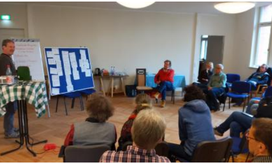
Bei der Zukunftswerkstatt im April 2023: Präsentation der Ergebnisse