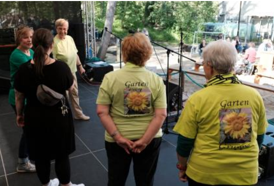
Die Gartengruppe auf der Bühne bei der Geburtstagfeier am 30. April 2023